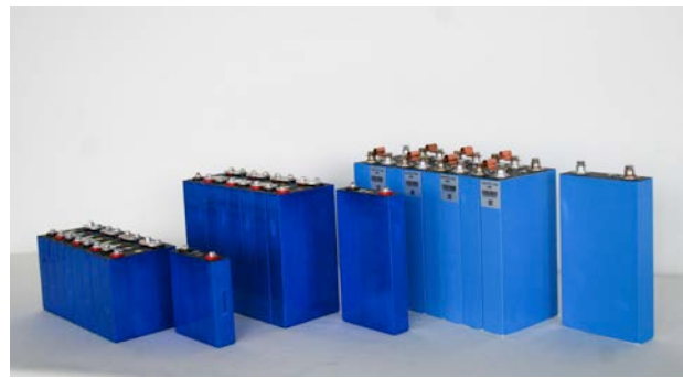
Zellen 50 Ah, 80 Ah, 105 Ah